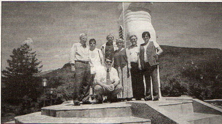
Sa prijateljima kraj spomenika braniteljima u Goraždu

Nenametljiv, s blagim osmijehom, uvijek je spreman pomoći. Posebno se zauzima da bh. omladina pohađa dobre škole i fakultete jer, kaže, na svom primjeru osjetio je koliko je škola važna. Prokrstaro je Bosnom uzduž i poprijeko. Posebno su ga oduševili Stari most u Mostaru, Višegradska čuprija i spomenik braniteljima 92-95. u Goraždu.